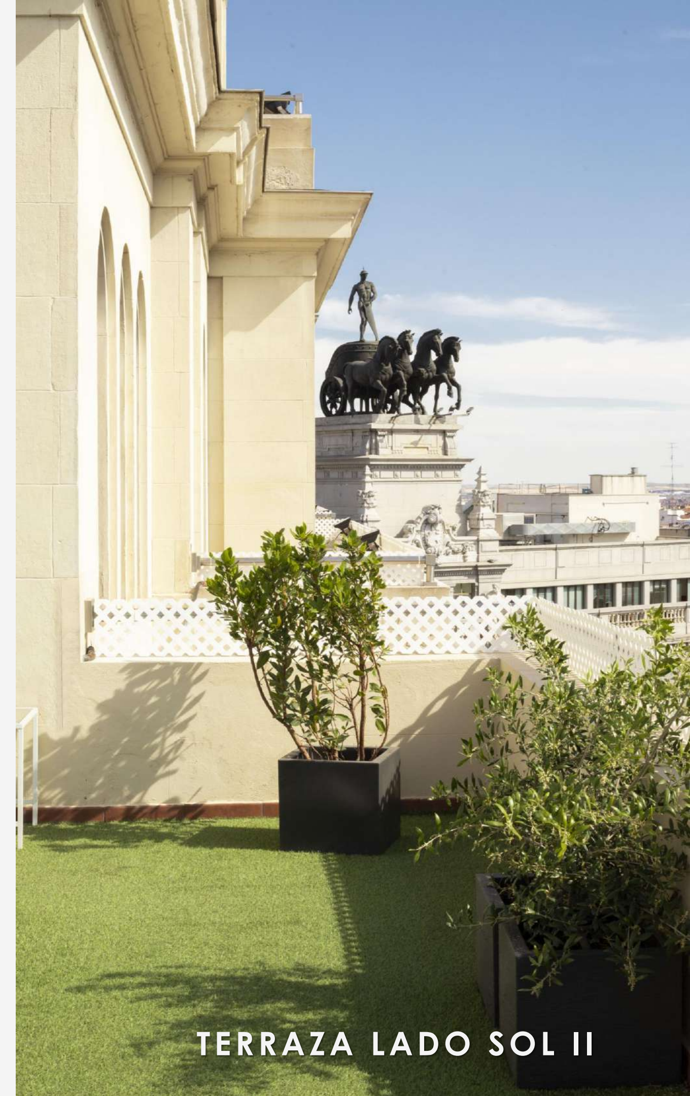
TERRAZA LADO SOL II