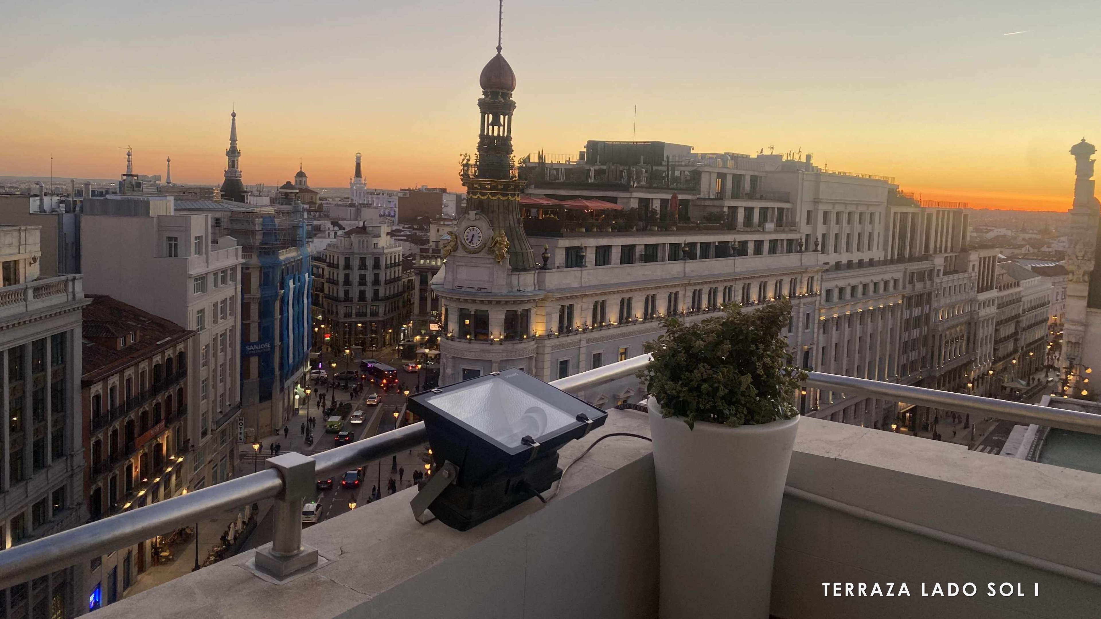
TERRAZA LADO SOL I